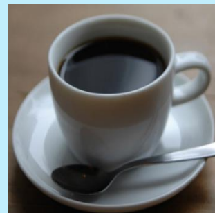
美味しいコーヒーや紅茶を 飲みながら会議を

※主催者様によるお飲み物の手配はドリンクデリバリーサービス又は、 館内自動販売機をご利用ください。お持ち込みはお断りしております。 但し、来場者様が水分補給のためにご自身の水筒を利用する場合はこれに限りません。