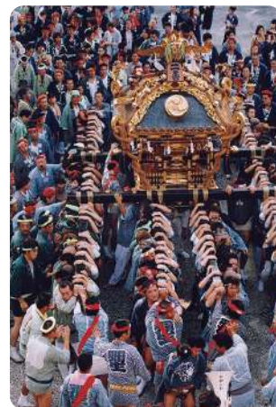
第10回大判部門金賞「御輿を担ぐ人々」