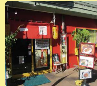
デリバリー三鷹に加盟している 一圖 三鷹南口店