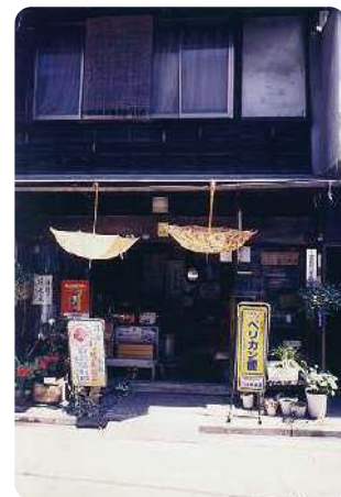
第3回サービス判金賞「開店休業」

主催 三鷹市/三鷹まちづくりフォトコンテスト実行委員会 (三鷹市、株式会社まちづくり三鷹、特定非営利活動法人みたか都市観光協会)