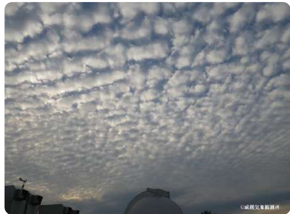
小さな雲がたくさん並ぶ高積雲(こうせきうん)

日時 10月18日(日)まで11:00~18:30(月・火・祝日休館) 場所 天文・科学情報スペース(三鷹市下連雀3-28-20三鷹中央ビル) 問合せ 天文・科学情報スペース ☎0422-26-9951