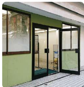
みたかスペースあい

問合せ ☎0422-40-9669 ✉ spaceai@mitaka.ne.jp 🌐 https://mitakaspaceai.mall.mitaka.ne.jp/