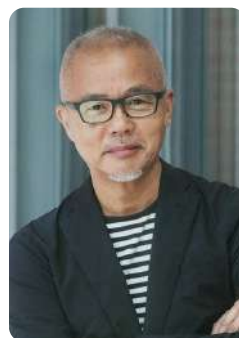
写真家 林 義勝さん