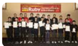
昨年度の入賞者の皆さん