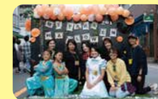
ハロウィンイベントにてスタッフ集合!