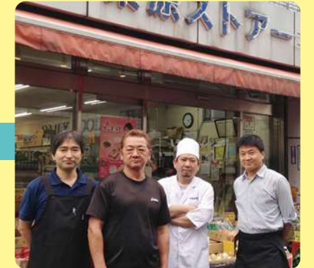
心づよいお助け隊

井の頭3丁目にある「五小通り商栄会」の5店舗では、配達無料の宅配サービス「おたすけ隊」を実施しています。「水1本でも、まぐろの刺身2枚でも、配達するよ!」というこのサービス。いったいどんな人たちが、どんなふう運営しているのでしょうか。