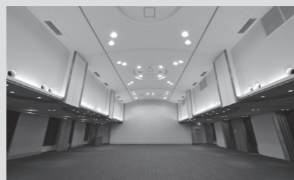
● 703-705 会議室 (定員 150名)