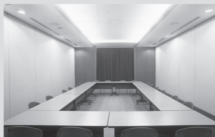
● 702 会議室 (定員 24名)