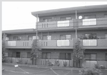
●ドゥマンクレール三鷹