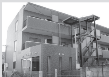
●セントラルビレッジ