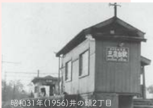
昭和31年(1956)井の頭2丁目